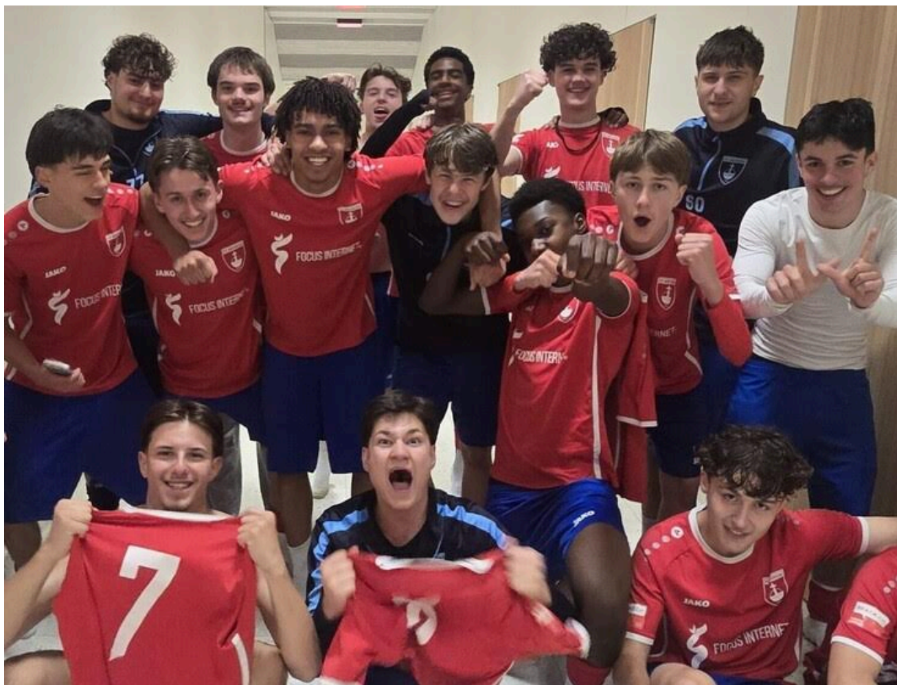
FINALSPIELE DES REGIONALCUPS